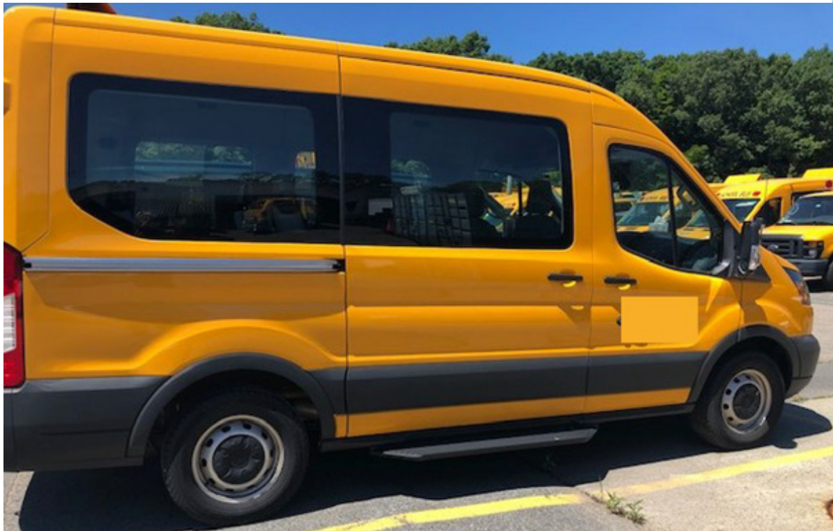
Figura 1: Exemplos de veículos 7D