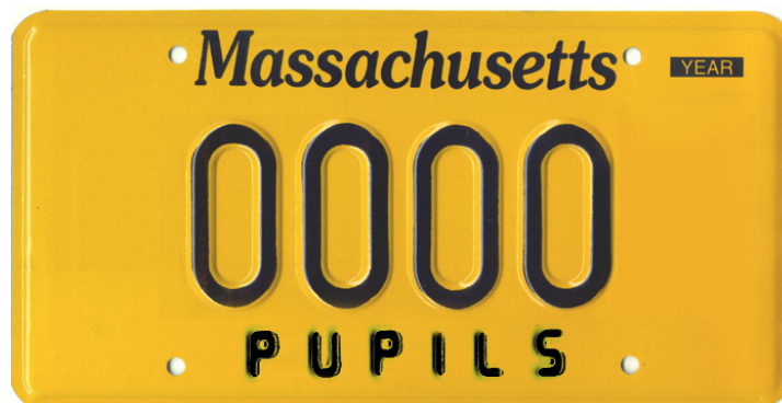
Figura 3: Exemplo de placa 7D com PUPILS escrito