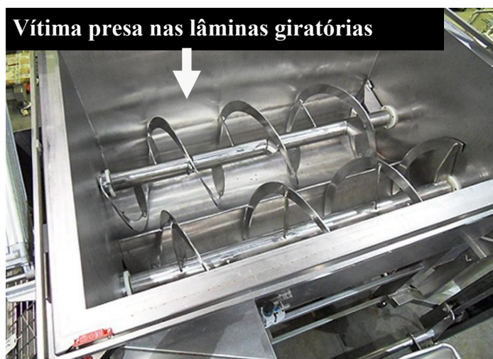
Vítima presa nas lâminas giratórias

Um funcionário de 40 anos de idade morreu em um misturador helicoidal em uma planta de processamento de peixe. A vítima e um colega foram escalados para lavar o misturador. Os funcionários no local não receberam o treinamento correto para remover restos de produto do misturador. A vítima entrou no misturador e o colega lhe alcançou uma mangueira. Quando a vítima puxou a mangueira para dentro do tanque, a mesma encostou no interruptor do misturador, acendeu-o e a vítima ficou presa entre as lâminas giratórias.