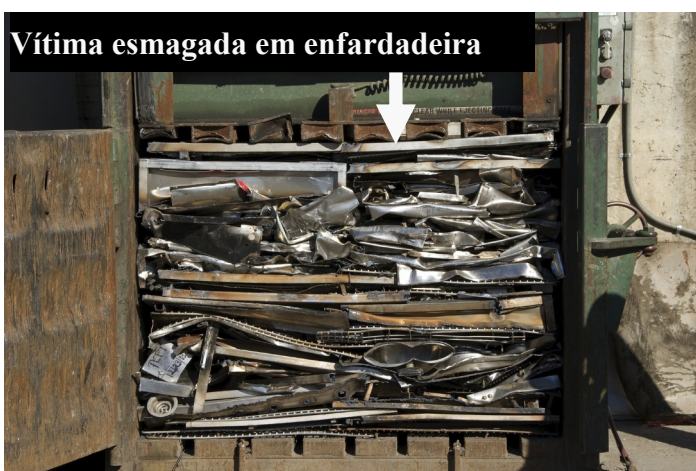
Vítima esmagada em enfardadeira