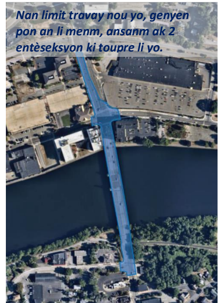
Nan limit travay nou yo, genyen pon an li menm, ansanm ak 2 entèseksyon ki toupre li yo.