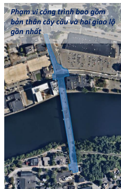
Phạm vi công trình bao gồm bản thân cây cầu và hai giao lộ gần nhất