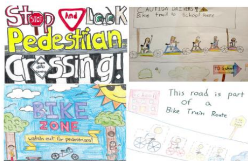
2022 Winning Designs