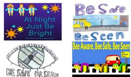
2021 Winning Designs