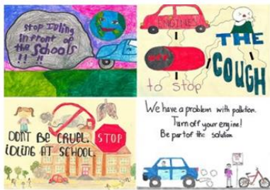
2019 Winning Designs