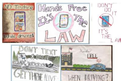
2020 Winning Designs