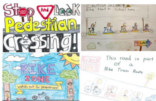
2022 Winning Designs