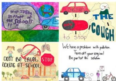
2019 Winning Designs