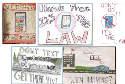
2020 Winning Designs