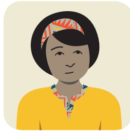
មានការឆ្លងរោគរបេង (TB) Has TB infection

It is important to take medicine for TB infection now.