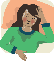
ເຫື່ອອອກຕອນກາງຄືນ Sweat at night

ຖ້າທ່ານບໍ່ສະບາຍຈາກພະຍາດປອດແຫ້ງ (TB), ທ່ານຍັງສາມາດແຜ່ເຊື້ອພະຍາດປອດແຫ້ງໄປຕິດໃສ່ຄອບຄົວ ແລະ ຄົນອື່ນໆໄດ້.