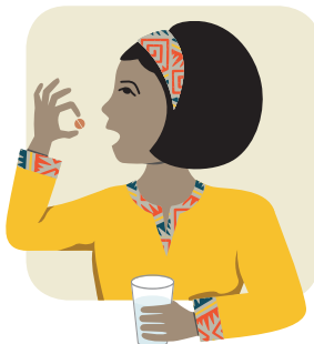
Umiinom ng gamot sa TB Takes TB medicine