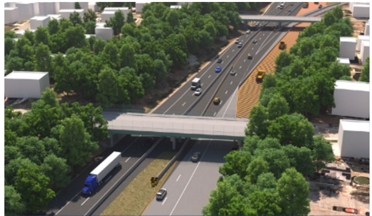
Figura 1. Representación del cruce de la I-195

Este proyecto se llevará a cabo en un total de cinco fases, cuya finalización está prevista para 2030. En las fases 1 y 2 se demolerá y reconstruirá el lado oeste de la I-195. La Fase 1 implicará la construcción de cruces en dirección oeste y el cambio del tráfico en dirección oeste a una configuración temporaria para iniciar la demolición de la I-195 en dirección oeste. La fase 2 implicará la demolición completa de la estructura en dirección oeste y la construcción de la nueva estructura en dirección oeste. También comenzará la construcción de la nueva estructura de la Ruta 18 en dirección norte.