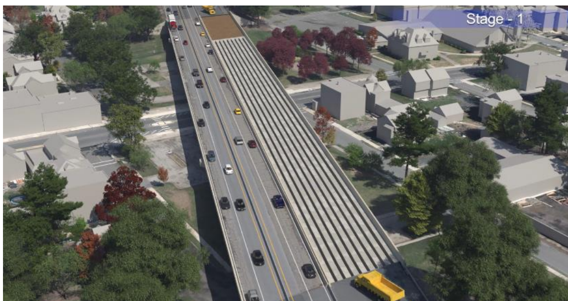
Рисунок 4: Ситуация с дорожным движением на трассе I-391 на первом этапе.