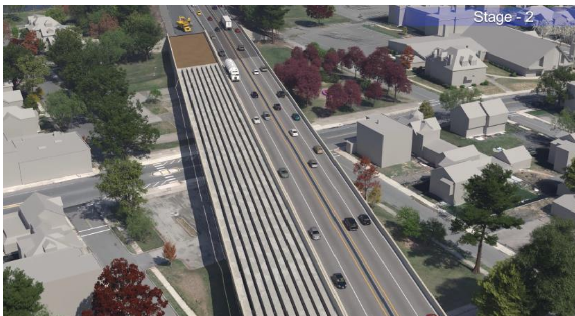
Рисунок 5: Ситуация с дорожным движением на трассе I-391 на втором этапе.