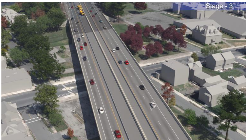
Рисунок 6: Ситуация с дорожным движением на трассе I-391 (этап 3).