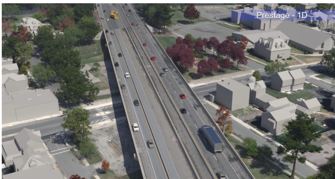
Рисунок 3: До начала первого этапа работ дорожная обстановка на трассе I-391.