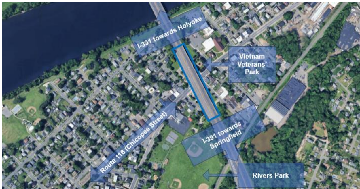
Figura 1: Mapa de locus