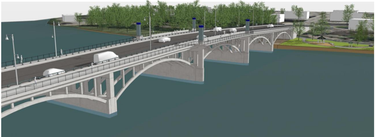
Figura 5: Proposta de vista noturna da ponte PFC Ralph T. Basiliere