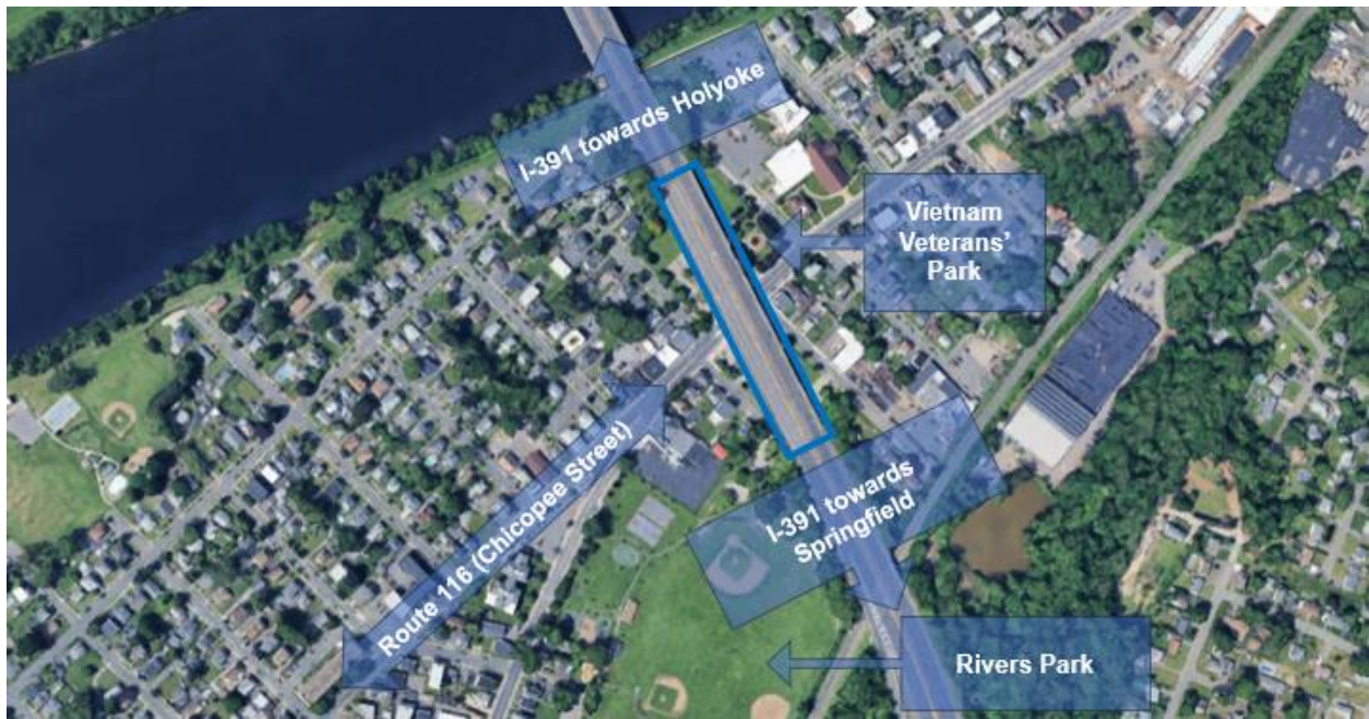
Figure 1: Locus Map