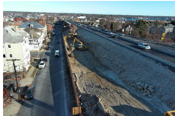
Figura 4. Eskavason na ladu di Rampa A