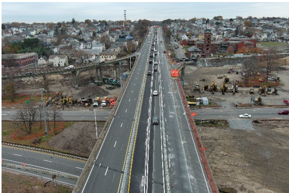
Figura 1. Konkluzon di Fazi 1