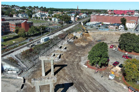
Figura 3. Demolison di Rampa C