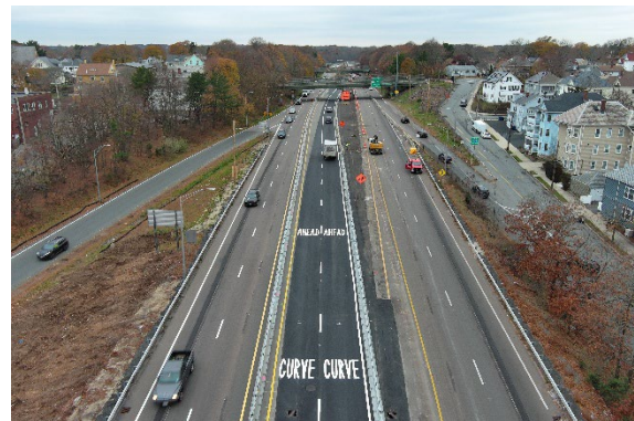
Imagen 2. Cambio al tráfico de la fase 2