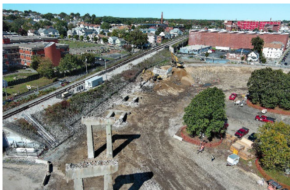
Imagen 3. Demolición de la Rampa C