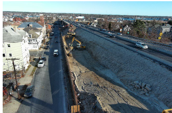
Imagen 4. Excavación a lo largo de la Rampa A