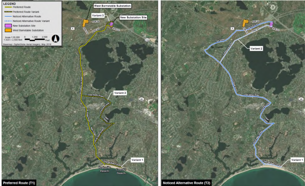
Imagem 2: Conector Vineyard Wind 2 - Rotas Terrestres, Aterro na Nova Subestação Terrestre

Uma versão maior desta imagem está disponível no seguinte link: https://fileservice.eea.comacloud.net/FileService.Api/file/FileRoom/12183564#page=9