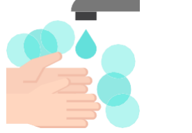
វិធានផ្នែកអនាម័យ

ធានាបាននូវការចូលទៅកន្លែងលាងដៃរួមទាំងមានសាប៊ូនិងទឹកទុយ និងអនុញ្ញាតឱ្យមានពេលវេលាសម្រាកគ្រប់គ្រាន់សម្រាប់កម្មករលាងដៃឱ្យបានញឹកញាប់។ ទឹកលាងដៃដែលមានជាតិអាស៊ីតយ៉ាងតិច ៦០% អាចនឹងត្រូវបានប្រើជំនួស