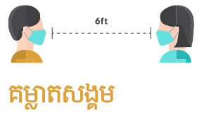
គម្លាតសង្គម

រៀបចំកៅអីទាំងអស់ដើម្បីអោយទឹកកន្លែងមានគម្លាតយ៉ាងតិច ៦ ហ្វីត ដំឡើងសញ្ញាសំគាល់ដែលមើលឃើញដើម្បីលើកទឹកចិត្តអតិថិជនអោយរក្សាគម្លាតយ៉ាងតិច ៦ ហ្វីតពីគ្នា ត្រូវញ៉ាំងអាហាររៀបចំត្រង់និងសម្រាកដាច់ដោយឡែកដោយកំណត់ចំនួនអតិបរមារវាងមនុស្សនៅពីកន្លែងមួយៗ និងធានាឱ្យចម្ងាយផ្នែករាងកាយយ៉ាងហោចណាស់ ៦ ហ្វីត បិទប្រាក់ណាត់ចន្លោះម៉ូឌុលកន្លែងធ្វើការរួមរបស់កម្មករនិងតំបន់ដែលមានដងស្រីក្នុងខ្លួនដែលជាកន្លែងកម្មករទំនងជាអាចប្រមូលផ្តុំគ្នាបាន (ឧទាហរណ៍..បន្ទប់សម្រាក កន្លែងបរិភោគអាហារ) អនុញ្ញាតឱ្យមានចម្ងាយឆ្ងាយពីគ្នាចំនួន ៦ ហ្វីត។ តម្រូវឱ្យមានការបិទបាំងមុខសំរាប់អតិថិជននិងកម្មករទាំងអស់លើកលែងតែបុគ្គលមិនអាចពាក់គម្របមុខដោយសារជម្ងឺរីករាលដាល តម្រូវឱ្យកម្មករពាក់ស្រោមដៃ សម្លៀកបំពាក់វែងសម្រាប់បុរសឬនារីនិងវ៉ែនតាការពារសុវត្ថិភាព វ៉ែនតាហែលទឹក