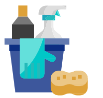
ការសម្អាតនិងការកម្ទាត់មេរោគ

លើកទឹកចិត្តដល់កម្មករដែលងាយរងគ្រោះដោយកូវីដ-១៩ យោងតាមមជ្ឈមណ្ឌលត្រួតពិនិត្យជម្ងឺ (ឧទាហរណ៍.. ដោយសារអាយុ ឬ លក្ខខណ្ឌមូលដ្ឋាន) ត្រូវស្នាក់នៅផ្ទះ លើកទឹកចិត្តកម្មករដែលមានធាតុសញ្ញា ឬសង្ស័យមានទំនាក់ទំនងជិតស្និទ្ធនឹងអ្នកមានធាតុសញ្ញាកូវីដ-១៩ ត្រូវវាយការណ៍ទៅនិយោជក លើកទឹកចិត្តកម្មករដែលធ្វើតេស្តវិជ្ជមានសំរាប់កូវីដ-១៩ ដើម្បីវាយការណ៍ទៅការិយាល័យនិយោជកក្នុងគោលបំណងសំអាត / កម្ទាត់មេរោគនិងតាមដានរាល់ទំនាក់ទំនង។