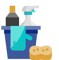
ការសម្អាតនិងការកម្ចាត់មេរោគ

ការអនុវត្តដ៏ប្រសើរដែលត្រូវបានណែនាំ ត្រូវបានលើកទឹកចិត្តដល់កម្មករដែលងាយរងគ្រោះដោយកូវីដ-១៩ យោងតាមមជ្ឈមណ្ឌលត្រួតពិនិត្យជម្ងឺ (ឧទាហរណ៍.. ដោយសារអាយុ ឬ លក្ខខណ្ឌមូលដ្ឋាន) ត្រូវស្នាក់នៅផ្ទះ លើកទឹកចិត្តកម្មករដែលមានធាតុសញ្ញាឬសង្ស័យមានទំនាក់ទំនងជិតស្និទ្ធនឹងអ្នកមានធាតុសញ្ញាកូវីដ-១៩ ត្រូវវាយការណ៍ទៅនិយោជក លើកទឹកចិត្តកម្មករដែលធ្វើតេស្តវិជ្ជមានសំរាប់កូវីដ-១៩ ដើម្បីវាយការណ៍ទៅការិយាល័យនិយោជកក្នុងគោលបំណងសំអាត / កម្ចាត់មេរោគនិងតាមដានរាល់ទំនាក់ទំនង។