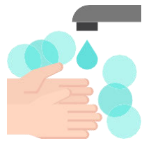
بروتوكولات النظافة الشخصية

انشر لافتات مرئية عبر الموقع لتذكير العاملين والزبائن ببروتوكولات النظافة الشخصية والسلامة