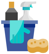
ការសម្អាត និង ការកម្ទាត់មេរោគ

សម្អាតផ្ទៃដែលប៉ះពាក់ញាប់ជាធម្មតានៅក្នុងបន្ទប់ទឹក (ឧទាហរណ៍... បានបង្កន់ កៅអី ដៃទ្វារ គន្លឹះទ្វារ កន្លែងលាងដៃ ប្រអប់ដាក់ក្រដាសជូត ប្រអប់ដាក់សាប៊ូ) ឱ្យបានញឹកញាប់ និងអនុលោមតាមគោលការណ៍ណែនាំរបស់ CDC