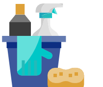
ការសម្អាត និងការកម្ចាត់មេរោគ

ពិចារណាកំណត់ពេលវេលាជាក់លាក់នៃប្រតិបត្តិការសម្រាប់តែប្រជាជនងាយរងគ្រោះ កំណត់ចំនួនបុគ្គលិក ដើម្បីបែងចែកតំបន់ធ្វើការក្នុងការកាត់បន្ថយការត្រួតស៊ីគ្នាជាអប្បបរមាតាមដែលអាចធ្វើទៅបាន