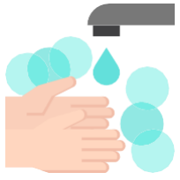
វិធានការ អនាម័យ