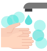
វិធានការអនាម័យ

ធានាថាការចូលទៅកន្លែងលាងដៃត្រូវមានសាប៊ូ និងទឹកទុយូ និងអនុញ្ញាតឱ្យមានពេលវេលាសម្រាកគ្រប់គ្រាន់សម្រាប់កម្មករលាងដៃឱ្យបានញឹកញាប់ ។ ទឹកលាងដៃដែលមានជាតិអាស៊ីតយ៉ាងតិច ៦០% អាចនឹងត្រូវបានប្រើជំនួស