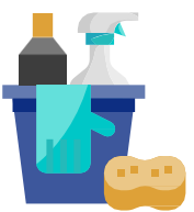
સફાઈ અને રોગાણુનાશન

જેઓનો COVID-19 પોઝિટિવ આવ્યો હોય એવા કામદારોને સફાઈ / રોગાણુનાશન અને કોન્ટેક્ટ ટ્રેસિંગના હેતુઓ માટે ઓફિસના નિયોજકને જાણ કરવા માટે આગ્રહ કરો