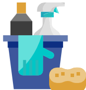
ការសម្អាត និង