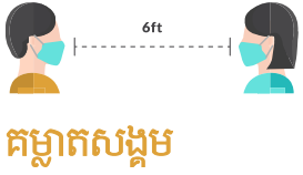
គម្លាតសង្គម

បណ្ណាល័យនីមួយៗត្រូវតាមដានរាល់ការចូលនិងការចេញរបស់អតិថិជន និងការកំណត់ការកាន់កាប់គ្រប់ពេលវេលា រហូតប្រសើរជាងនេះ៖