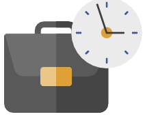
સ્ટાફ અને કામગીરીઓ

જ્યાં શક્ય હોય ત્યાં હવાનો પ્રવાહ વધારવા માટે બારીઓ અને બારણાં ખોલો