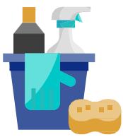
સફાઈ અને રોગાણુનાશન