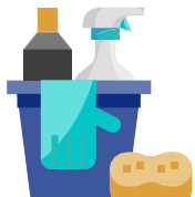
ការសម្អាត និង

លើកទឹកចិត្តកម្មករដែលធ្វើតេស្តវិជ្ជមានសំរាប់កូវីដ-១៩ ដើម្បីរាយការណ៍ទៅការិយាល័យនិយោជកក្នុងគោលបំណងសម្អាត / កម្ចាត់មេរោគ និងតាមដានរាល់ទំនាក់ទំនង ។