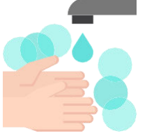
بروتوكولات النظافة الشخصية

تأكد من توفر مرافق لغسل اليدين في الموقع بما في ذلك الصابون والماء الجاري، حيثما أمكن، وشجع على غسل اليدين بشكل متكرر، ويجوز استخدام معقم لليدين يحتوي على كحول بنسبة لا تقل عن 60% كخيار بديل قم بإمداد العمال في موقع العمل بمنتجات تنظيف كافية (على سبيل المثال، معقم ومناديل مبللة مطهرة) ينبغي توفير معقمات لليدين تحتوي على 60% من الكحول على الأقل عند المداخل والمخارج وعبر جميع أرضيات المكان ليستخدمها كل من العاملين والزائرين تجنب تشارك المعدات والمستلزمات بين العاملين طهر المعدات المشتركة قبل استخدام موظف آخر لها انشر لافتات مرئية عبر الموقع لتذكير العاملين بروتوكولات النظافة الشخصية والسلامة.