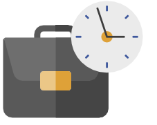
فريق العمل وعمليات مزاولة النشاط