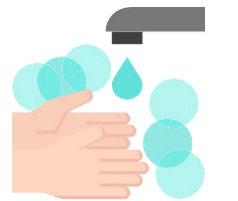
بروتوكولات النظافة الشخصية

تأكد من توفر مرافق غسل اليدين في الموقع بما في ذلك الصابون والماء الجاري، واسمح للعمال بوقت استراحة كافٍ لغسل أيديهم بشكل متكرر، ويمكن استخدام معقم لليدين يحتوي على كحول بنسبة لا تقل عن 60% كخيار بديل إجراء تعقيم منتظم للأماكن متكررة اللمس مثل المكاتب والمعدات والشاشات ومقابض الأبواب ودورات المياه، في كافة أرجاء موقع العمل قم بإمداد العاملين في موقع العمل بمنتجات تنظيف كافية (على سبيل المثال، معقم ومناديل مبللة مطهرة) انشر لافتات مرئية عبر الموقع لتذكير العاملين والزبائن بروتوكولات النظافة الشخصية والسلامة ينبغي توفير معقمات لليدين تحتوي على 60% من الكحول على الأقل عند المداخل وعبر جميع أرضيات المكان ليستخدمها كل من العاملين والزبائن تجنب تشارك المعدات والمستلزمات بين العمال طهر المعدات المشتركة قبل استخدام عامل آخر لها