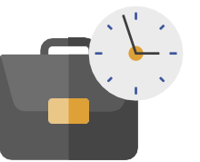
فريق العمل وعمليات مزاولة النشاط