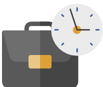
ការរៀបចំបុគ្គលិកនិង

សមាជិកទស្សនិកជនគួរតែគ្រប់គ្រងមុខពេលអង្គុយក្នុងពេលសម្រួល លើកលែងតែគ្មានសុវត្ថិភាពដោយសារពិការភាព ឬ ស្ថានភាពសុខភាព