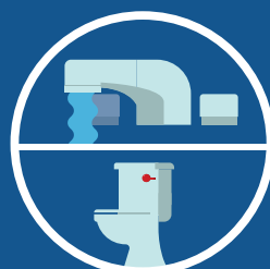
SUPERFÍCIES DO BANHEIRO (TORNEIRAS & DESCARGA)