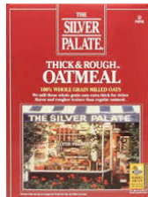
Silver Palate Thick & Rough Oatmeal