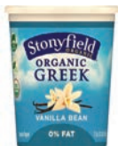
Stonyfield Organic, Greek • Qualquer sabor