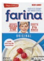
Farina • Original Hot Wheat Cereal