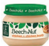
Beech-Nut Classics (Stage 1)