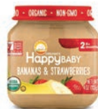
Happy Baby Organics (Stage 1 & Stage 2)