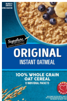
Signature Select 🌾 Instant Oatmeal (Regular)