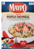
Maypo 🌾 Maple Oatmeal 🌾 Vermont Style Aveia