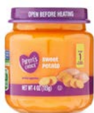
Parent's Choice (Stage 1 & Stage 2)