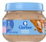
Gerber (Stage 2)