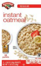
Hannaford 🌾 Instant Oatmeal (Regular)