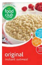
Food Club 🌾 Instant Oatmeal (Regular)