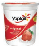
Yoplait • Qualquer sabor