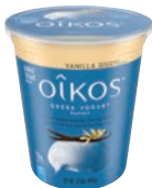
Oikos Greek • Qualquer sabor