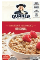
Quaker Instant Oatmeal Packets 🌾 Maple Oatmeal