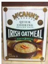
McCann's Irish Oatmeal