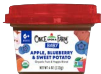
Once Upon a Farm