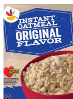
Stop & Shop 🌾 Instant Oatmeal (Regular)