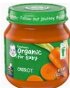
Gerber Organic (1st & 2nd Foods)