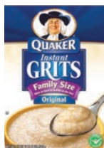
Quaker Instant Grits