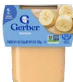
Gerber (2nd Foods)