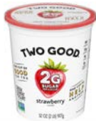
Two Good • Qualquer sabor