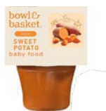
Bowl &amp; Basket

*Deve ter na descrição dos seus benefícios o pacote de 2 embalagens para ser possível a compra.