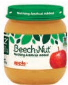
Beech-Nut (Stage 2)