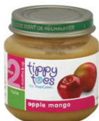
Tippy Toes (Stage 2)