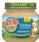
Earth's Best (Stage 1)