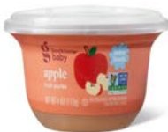
Good & Gather