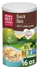
Mom's Best Quick Oats