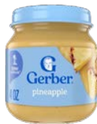
Gerber Naturals (1st & 2nd Foods)