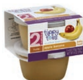
Tippy Toes (Stage 2)