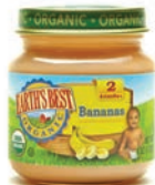
Earth's Best (Stage 2)