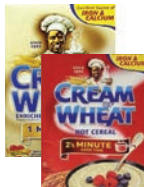
Cream of Wheat • 1 Minute • 2½ Minute