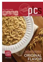
Pic's by Price Chopper 🌾 Instant Oatmeal (Regular)