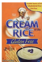
Cream of Rice GF Gluten Free